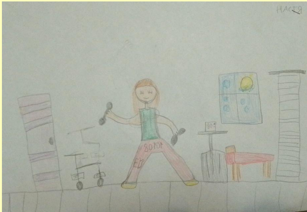
«Зарядка», рисунок Насти