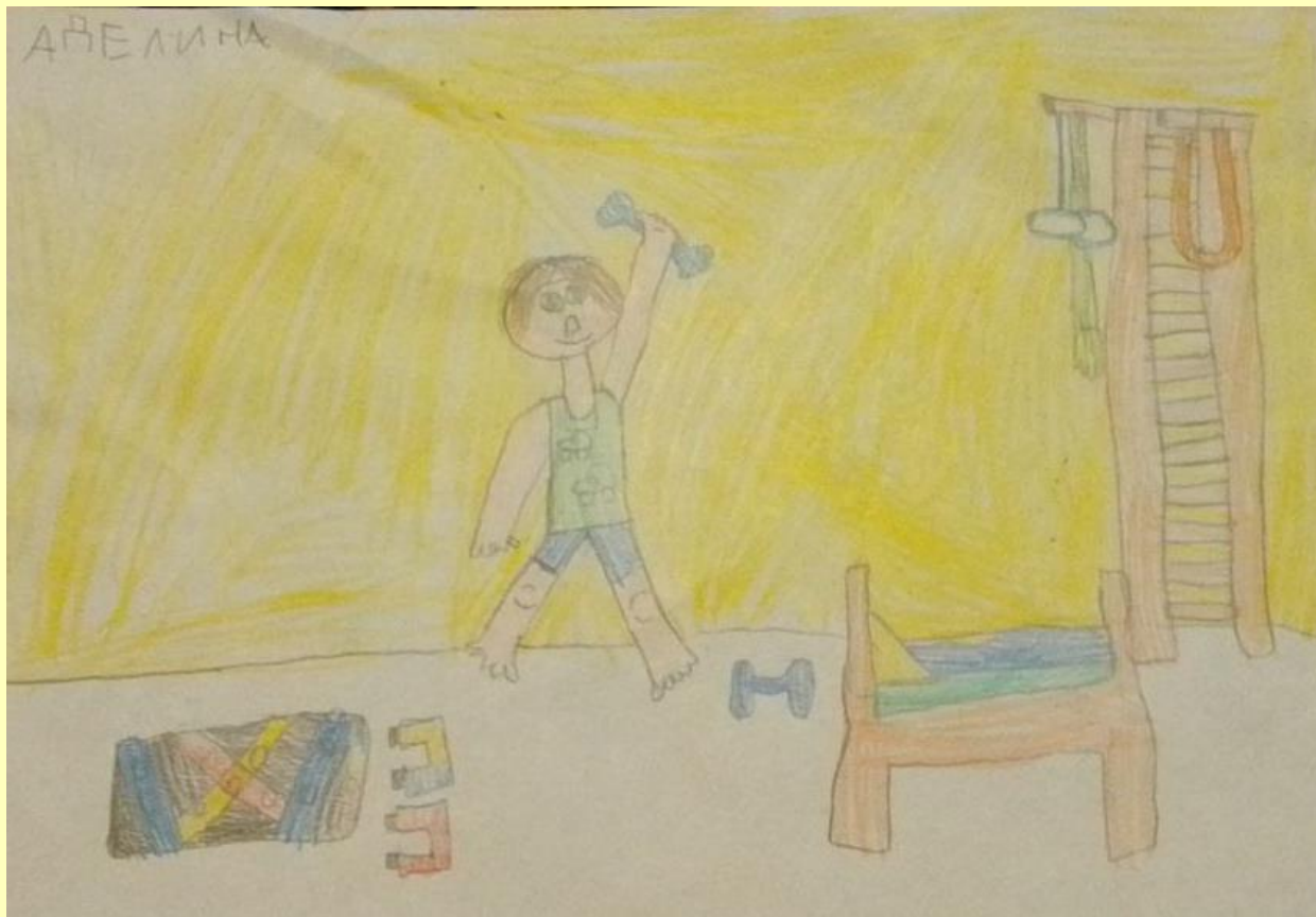
«Утро спортсмена», рисунок Аделины