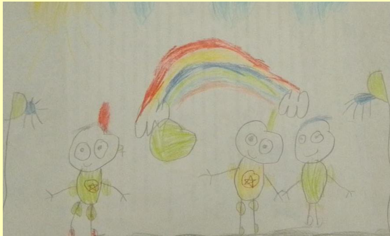
«Играем в волейбол», рисунок Ани